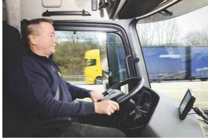
Gesucht, aber doch oft unterbezahlt: Noch wirkt sich der demografische Wandel nicht aufs Lohnniveau aus.

Das verstößt gegen das sogenannte Transparenzgebot nach Paragraph 307, Abs.1, Satz 2 des