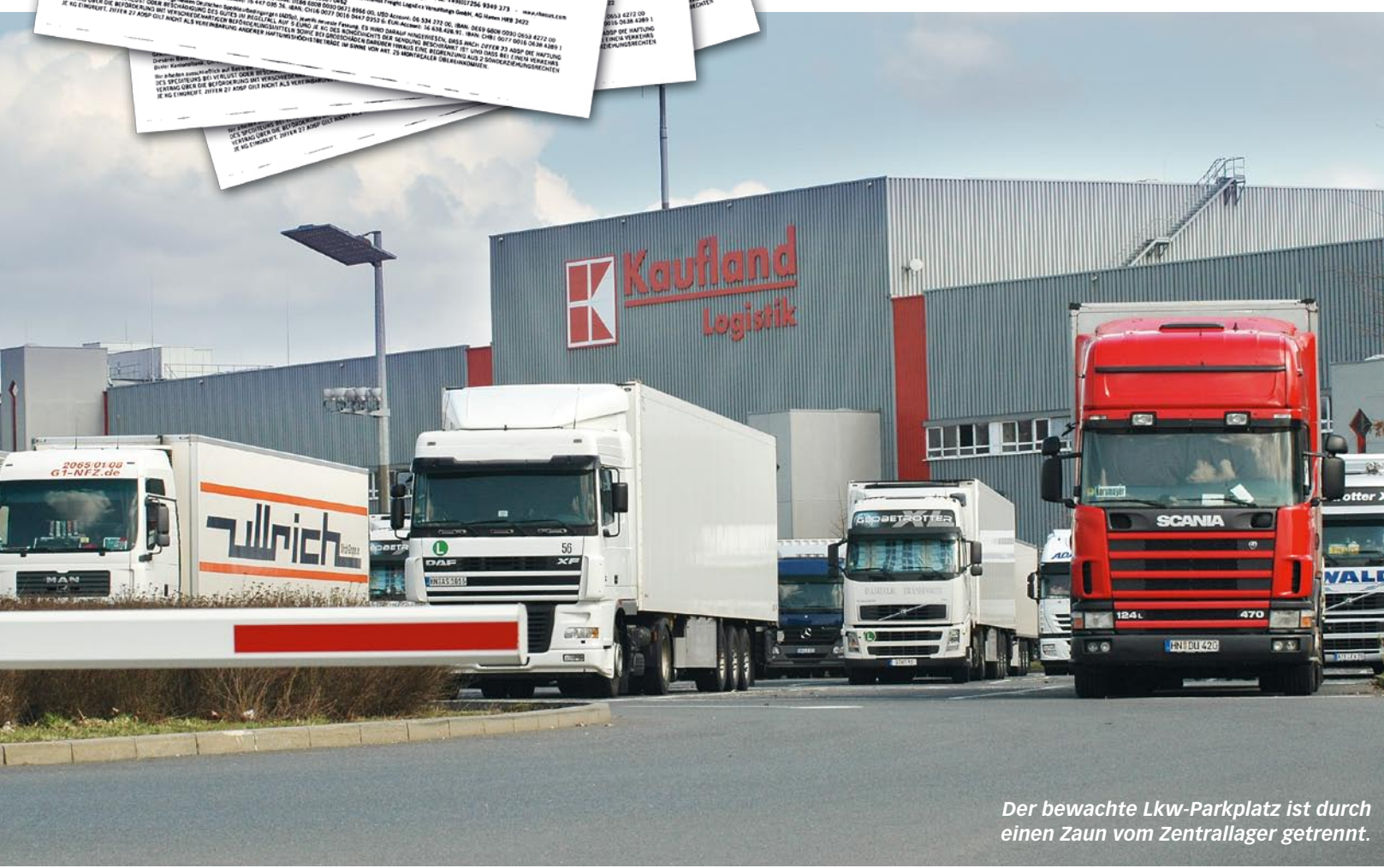
Der bewachte Lkw-Parkplatz ist durch einen Zaun vom Zentrallager getrennt.