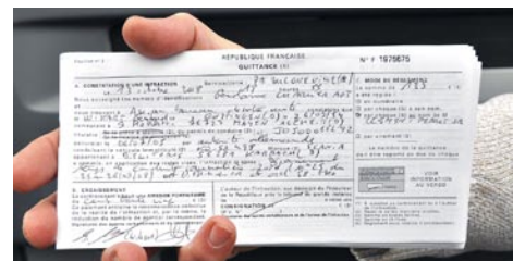
Wegen schlechter Planung musste Wikart schon mal in Frankreich kräftig zahlen.

Eure Meinung dazu im Blog auf www.fernfahrer.de