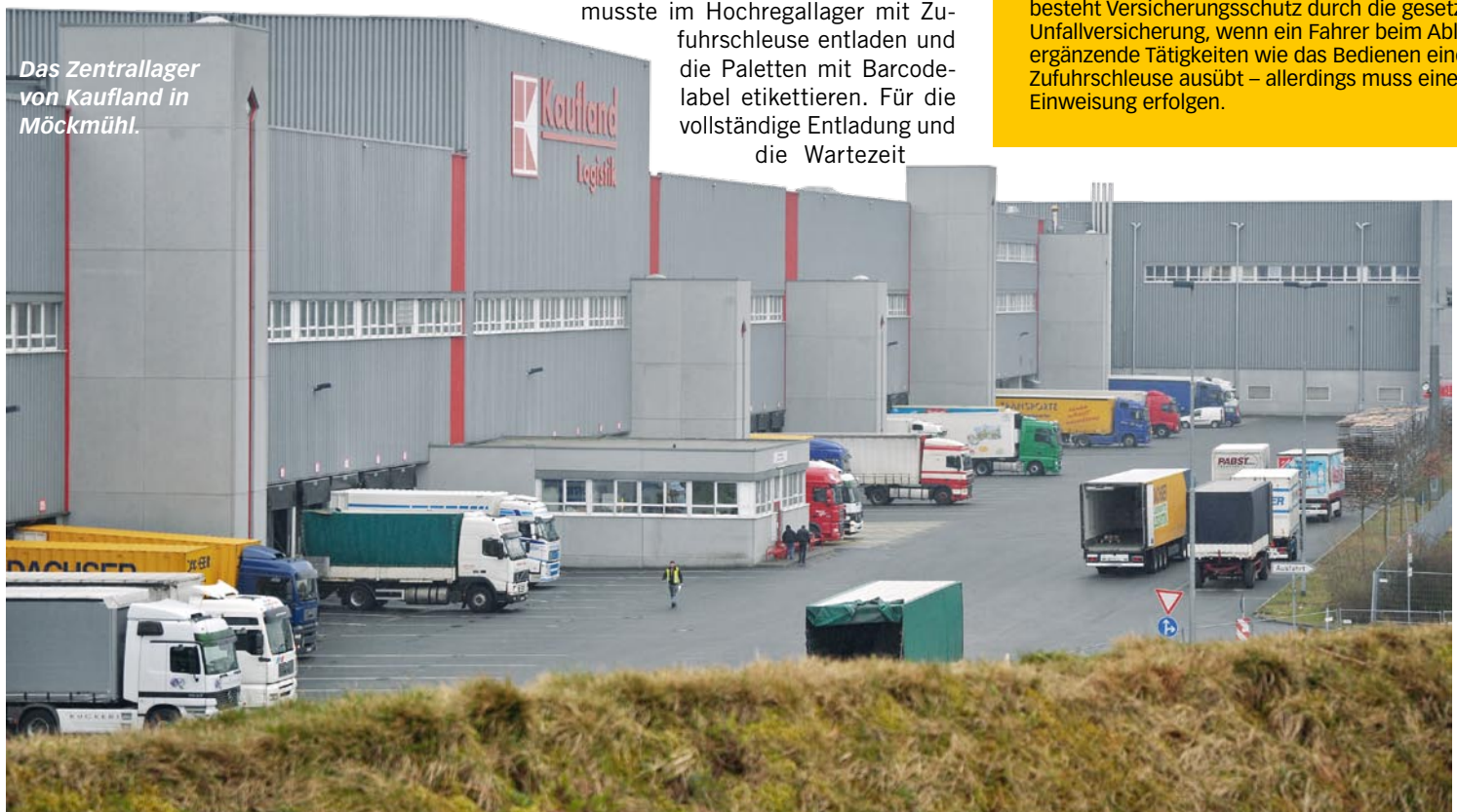
Das Zentrallager von Kaufland in Möckmühl.

der Paletten an seinen Kunden verkauft, muss der Fahrer diese durchführen, egal ob sein Chef sie dem Kunden berechnet oder nicht. Egal, was der Fahrer arbeitet, er wird für ein Wochenmittel von 48 Stunden inklusive der Lenkzeit bezahlt. Die Fahrer müssen die Art ihrer Tätigkeit im Kontrollgerät aufzeichnen. Wer beim Abladen auf Pause stellt, begeht einen Verstoß gegen die Verordnung (EWG) Nr. 3821/85 und betrügt sich selbst mit unbezahlter Mehrarbeit. Grundsätzlich besteht Versicherungsschutz durch die gesetzliche Unfallversicherung, wenn ein Fahrer beim Abladen ergänzende Tätigkeiten wie das Bedienen einer Zufuhrschleuse ausübt – allerdings muss eine Einweisung erfolgen.