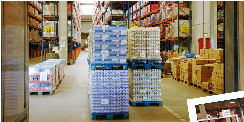
Beim Entladen sind Lkw-Fahrer grundsätzlich versichert.

gestalten, dass sich die Fahrer an die Bestimmungen halten können, es müssen auch alle an der Transportkette beteiligten Unternehmen sicherstellen, dass die vertraglich vereinbarten Beförderungszeitpläne nicht gegen die Verordnung verstoßen.